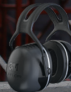
3M™ PELTOR™ Earmuff X5 Black