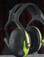
3M™ PELTOR™ Earmuff X4 Bright green