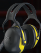
3M™ PELTOR™ Earmuff X2 Yellow