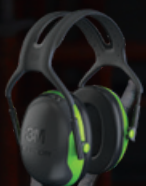
3M™ PELTOR™ Earmuff X1 Green

Barva: Každý chránič sluchu je unikátně barevně označen pro rychlou vizuální orientaci a lze identifikovat úroveň ochrany, kterou nosíte.