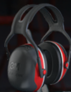
3M™ PELTOR™ Earmuff X3 Red